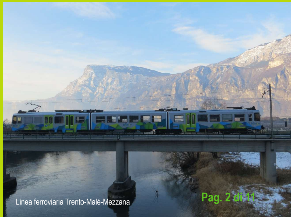
Linea ferroviaria Trento-Malé-Mezzana