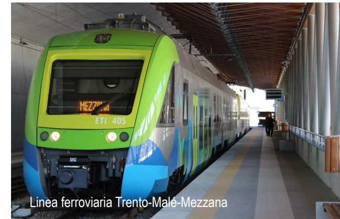
Linea ferroviaria Trento-Malé-Mezzana