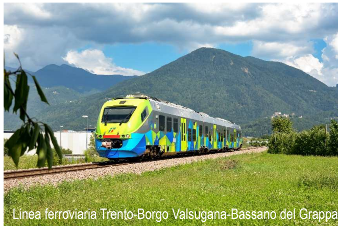
Linea ferroviaria Trento-Borgo Valsugana-Bassano del Grappa

Altre informazioni di dettaglio sul servizio a persone disabili o con ridotta mobilità sono descritte alla sezione «Assistenza».