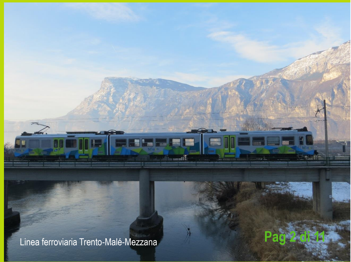
Linea ferroviaria Trento-Malé-Mezzana