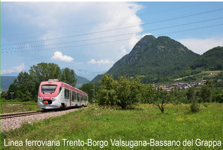
Linea ferroviaria Trento-Borgo Valsugana-Bassano del Grappa

Oltre ai canali di comunicazione precedentemente descritti per tutti i clienti, le persone disabili o con ridotta mobilità possono richiedere informazioni sulla fruibilità dei servizi scrivendo un messaggio di posta elettronica all'indirizzo ferrovia@trentinotrasporti.it . Sulla Linea ferroviaria Trento-Borgo Valsugana-Bassano del Grappa, la gestione dei servizi a terra per le persone con disabilità e a mobilità ridotta è offerta da Rete Ferroviaria Italiana – RFI S.p.A. Altre informazioni di dettaglio sul servizio a persone disabili o con ridotta mobilità sono descritte alla sezione «Assistenza».