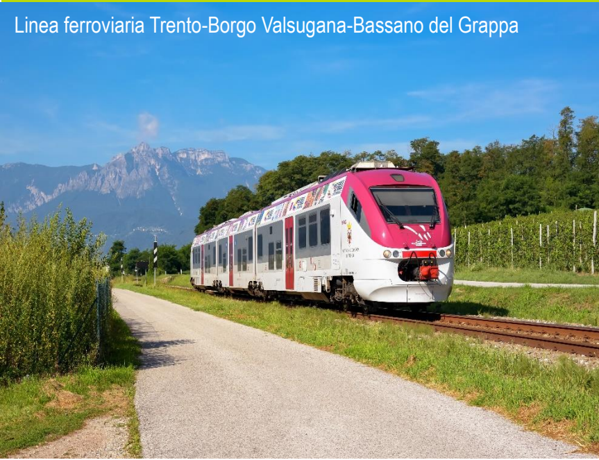
Linea ferroviaria Trento-Borgo Valsugana-Bassano del Grappa