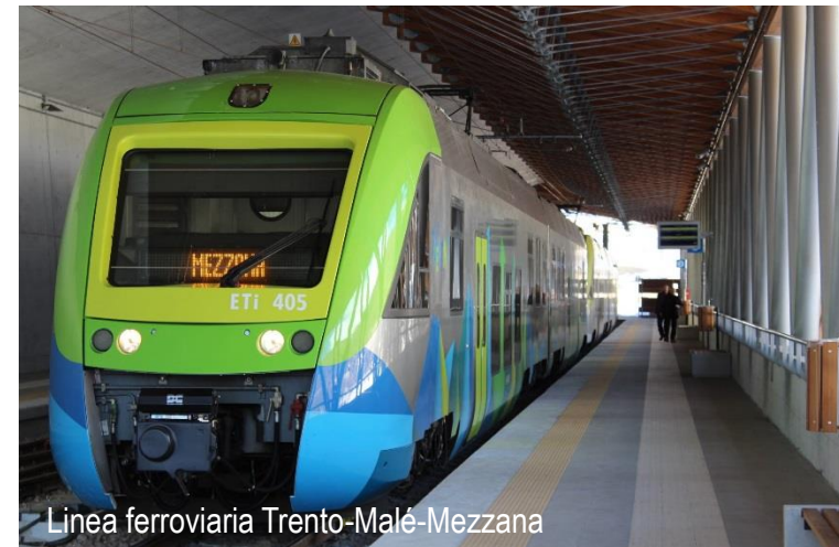
Linea ferroviaria Trento-Malé-Mezzana