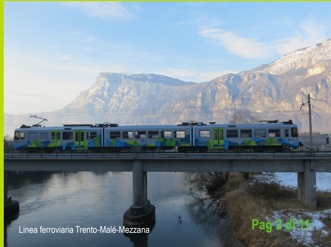
Linea ferroviaria Trento-Malé-Mezzana

7_ Assistenza alle persone con disabilità e mobilità ridotta