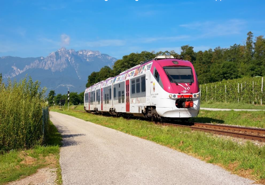
Linea ferroviaria Trento-Borgo Valsugana-Bassano del Grappa