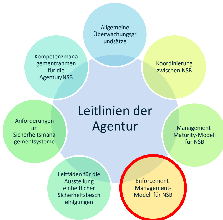
Abbildung 1: Leitlinienkompodium der Agentur

NSB sollten bei der Ausübung ihrer Funktionen nach nationalem und EU-Recht mit anderen Regulierungsagenturen zusammenarbeiten. Weitere Informationen zur Zusammenarbeit mit anderen Agenturen enthält der Leitfaden der Agentur zur Überwachung .