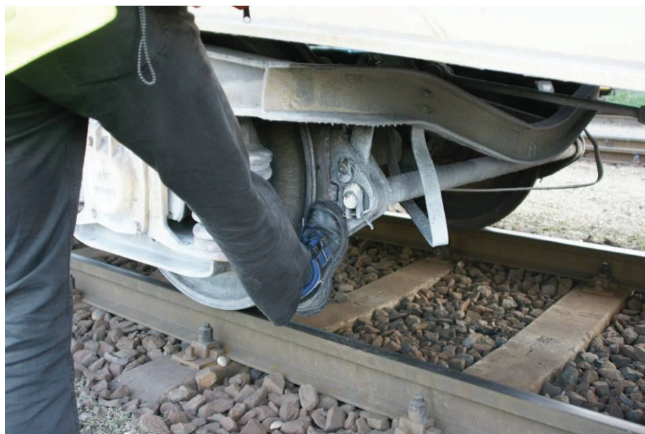
3. ábra A baleset bekövetkezése - illusztráció-

A tolatómozdonyral a második szerelvényrészhez visszatérve azt a mozdonyral összekapcsolták. Ezt követően a tolatásvezető az ilyenkor előírt fékezési és oldási vizsgálat helyett a fékek feloldására és a szerelvény lassú megindítására utasította a mozdonyvezetőt, majd a szerelvény vége felé indult. A mozdonyvezető a vonatot kb. 4-6 km/h sebességre gyorsította. A szerelvény megmozdulását követően a kismértékben fékező kocsi felől a tolatásvezető meghallotta az éles hangot, ezért oda indult. A féktuskó helyzetét kiértékelve úgy vélte, hogy csupán néhány millimétert kellene a féktuskónak távolodnia keréktől és a fék teljesen feloldódna. Ezért megkísérelte a féktuskót rögzítő sarut jobb lábával megrúgva eltávolítani a keréktől.