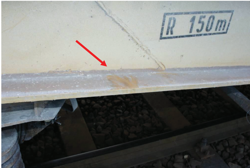
4. ábra Kapaszkodási kísérlet nyoma

A rúgás közben a lába a saruról lecsúszott, melynek következtében egyensúlyát elveszítve a kocs alá esett. Esés közben megpróbált megkapaszkodni a jármű főkeretében, azonban a szerelvény mozgása következtében egyensúlyát nem tudta időben visszanyerni és a kocs alá kimászni. Jobb lába az utolsó forgóváz első kereke alá került.