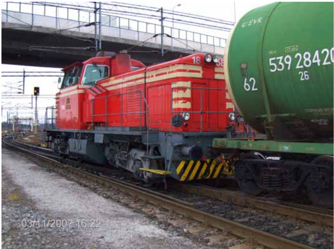
Kuva 3. Veturin etutelin ensimmäinen akseli suistui kiskoilta.

Bild 3. Den främre axeln i lokets framboggi spårade ur.