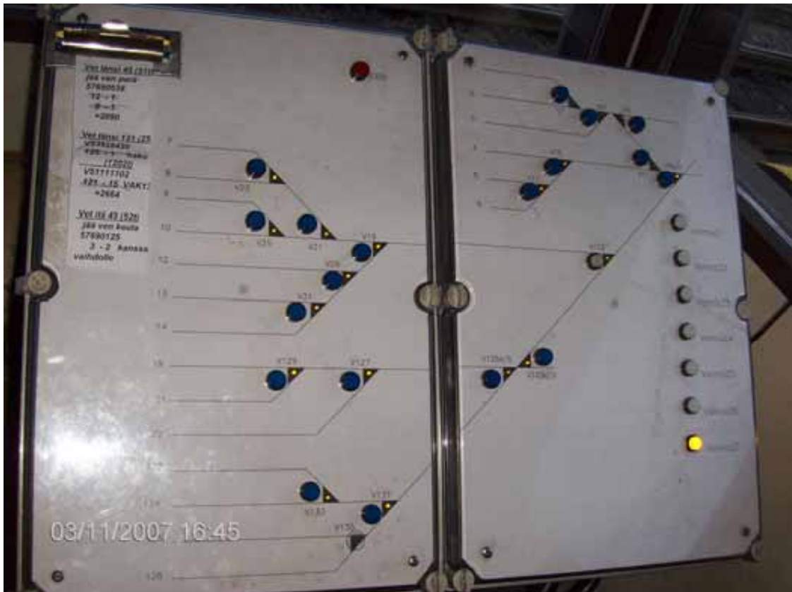
Kuva 4. Vaihdekojussa oleva ohjaustaulu. Vaihteita käännetään sinisillä painonapeilla. Vaihteen ilmaisimena on valkoinen valo vaihdekuviossa.

Vaihde V123 oli varustettu sähköisellä valvonnalla, joka valvoo vaihteen asentoa ja aukiajoa. Vaihde oli varustettu Railex-lukitsimella. Lukitsin avustaa vaihteenkääntölaitetta kääntämään vaihteen kielten takaosan ja pitää kielten aseman oikeana siten, että vaihteen aseman valvonta mahdollistuu.