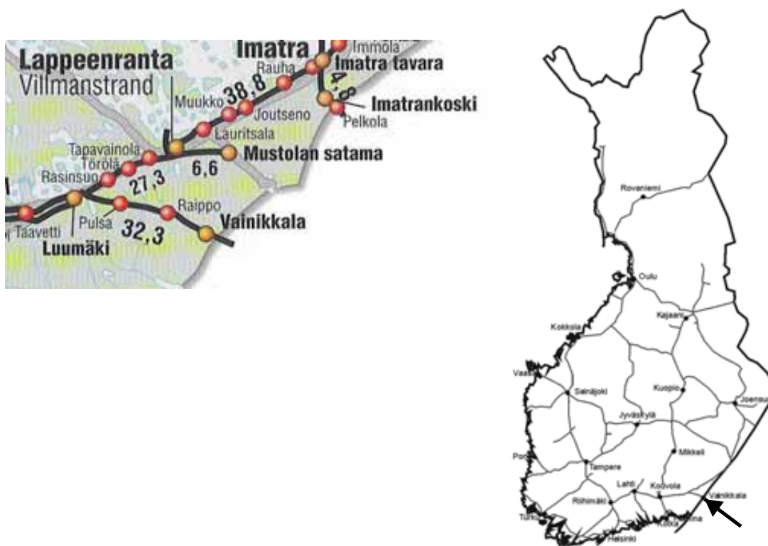
Kuva 1. Vaihtotyöyksikön veturi suistui Vainikkalassa.

Suistuminen tapahtui lauantaina 3.11.2007 kello 12.59 Vainikkalan ratapihan vaihteessa V123, kun vaihtotyöyksikkö oli työntämässä vaunuja raiteelle 121.