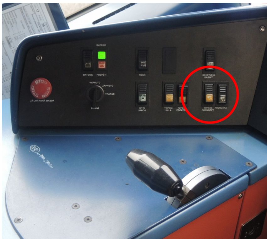
Obr. č. 3: Umístění přepínače topení podnožky

Následně podal tento řidič vysvětlení DPP, kde uvedl, že mezi zastávkami Palackého náměstí a Jiráskovo náměstí se na okamžik nevěnoval řízení tramvaje z důvodu hledání přepínače topení podnožky, který jinak běžně nepoužívá, a tím přehlédl před ním stojící tramvaj 15T, která zastavila z důvodu signálu „Stůj“ na SSZ. Jako příčinu vzniku MU řidič této tramvaje uvedl: „ vlastní nepozornost, nevěnování se řízení “. Toto následné vysvětlení považuje DI za nevěrohodné, neboť přepínač topení podnožky se v tramvaji typu 14T nachází v bezprostřední blízkosti řadiče (jízdní páky), je dobře dostupný i viditelný (kontrastní provedení, umístěn na ploše nakloněné vůči řidiči) a jeho obsluha by neměla řidiče rozptýlit na 11 s. Pokud řidič hovoří o hledání přepínače, tj. nejistotě, kde se daný přepínač nachází, je nebezpečné provádět tuto činnost za jízdy. Takto dlouhé rozptýlení by mohlo svědčit o naprosté ztrátě povědomí o čase, rychlosti a poloze tramvajového vlaku v prostoru, jehož příčinou by neměla být u tak zkušeného řidiče vlastní nepozornost, ale toto rozptýlení lze naopak vysvětlit právě tzv. mikrospánkem, který řidič uvedl v podání vysvětlení pro DI.