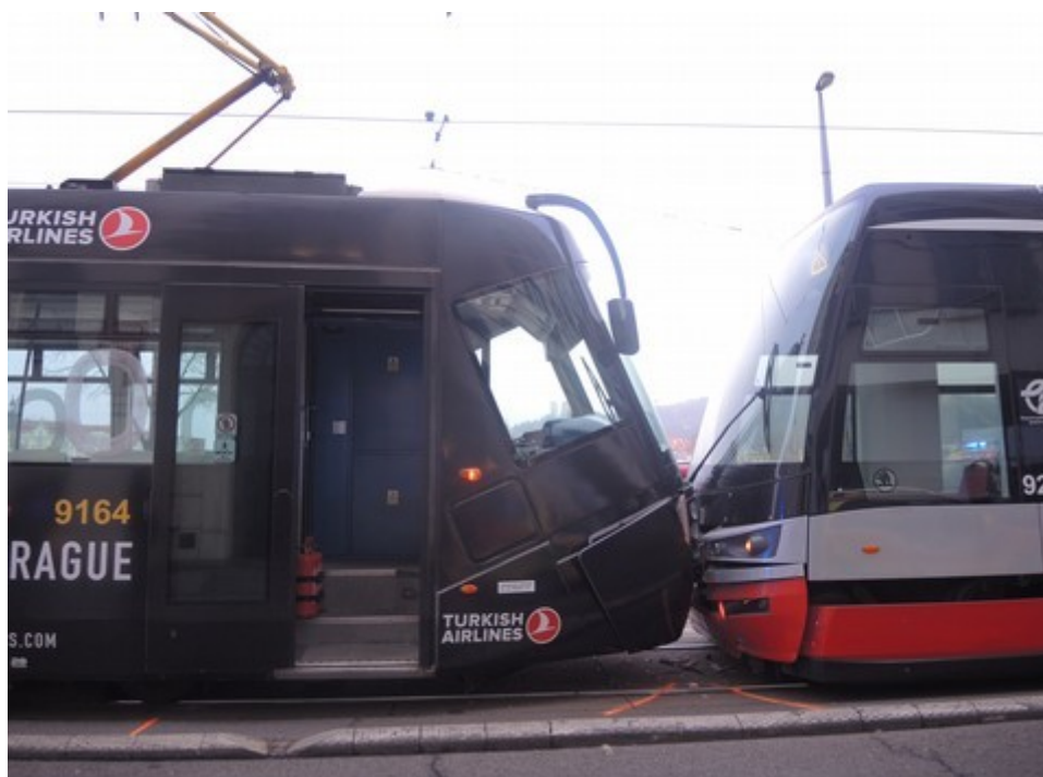
Obr. č. 1: Konečné postavení DV