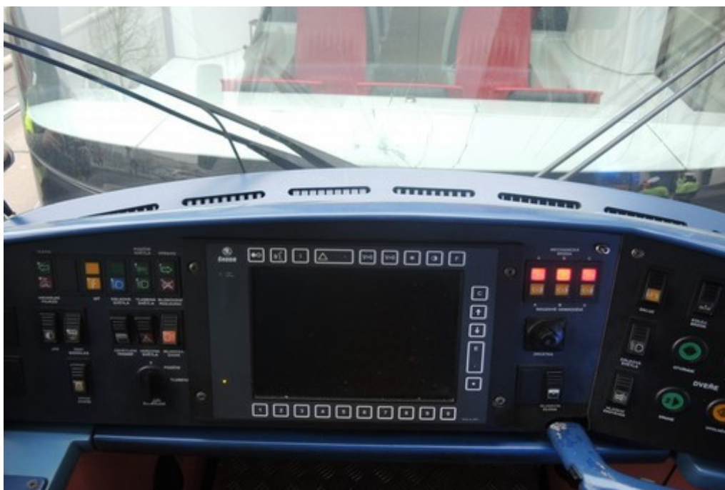
Obr. č. 5: Pohled na stanoviště řidiče tramvaje 17/29