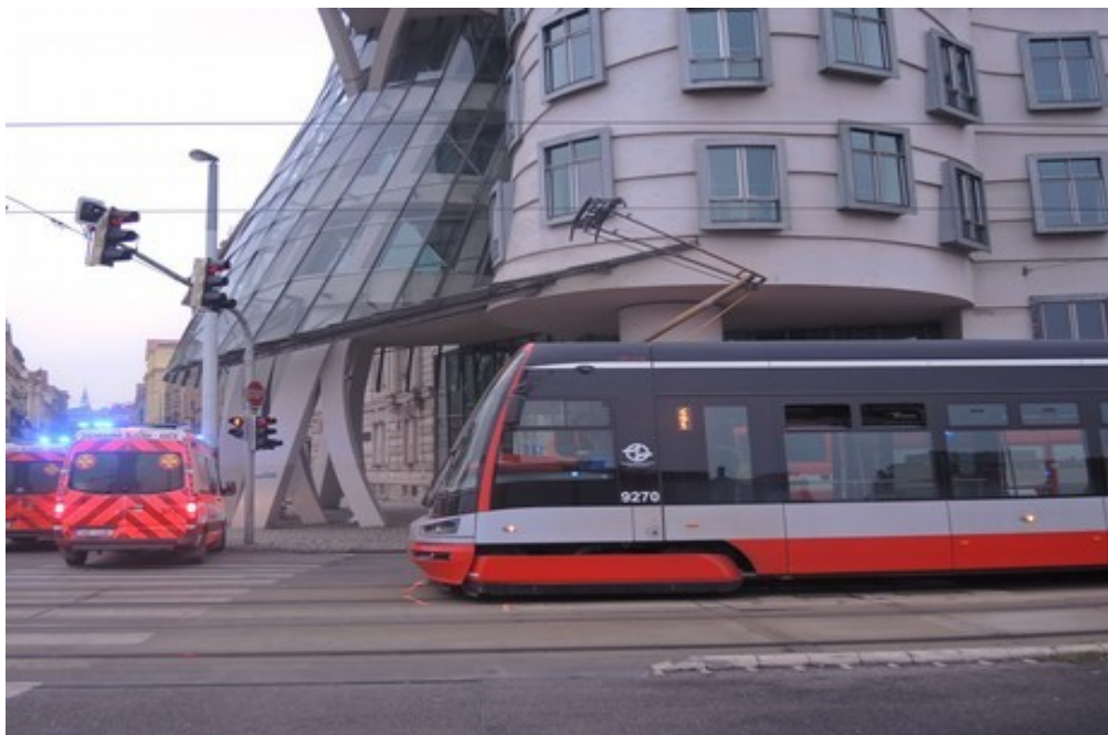
Obr. č. 4: Pohled na konečné postavení tramvaje 17/3