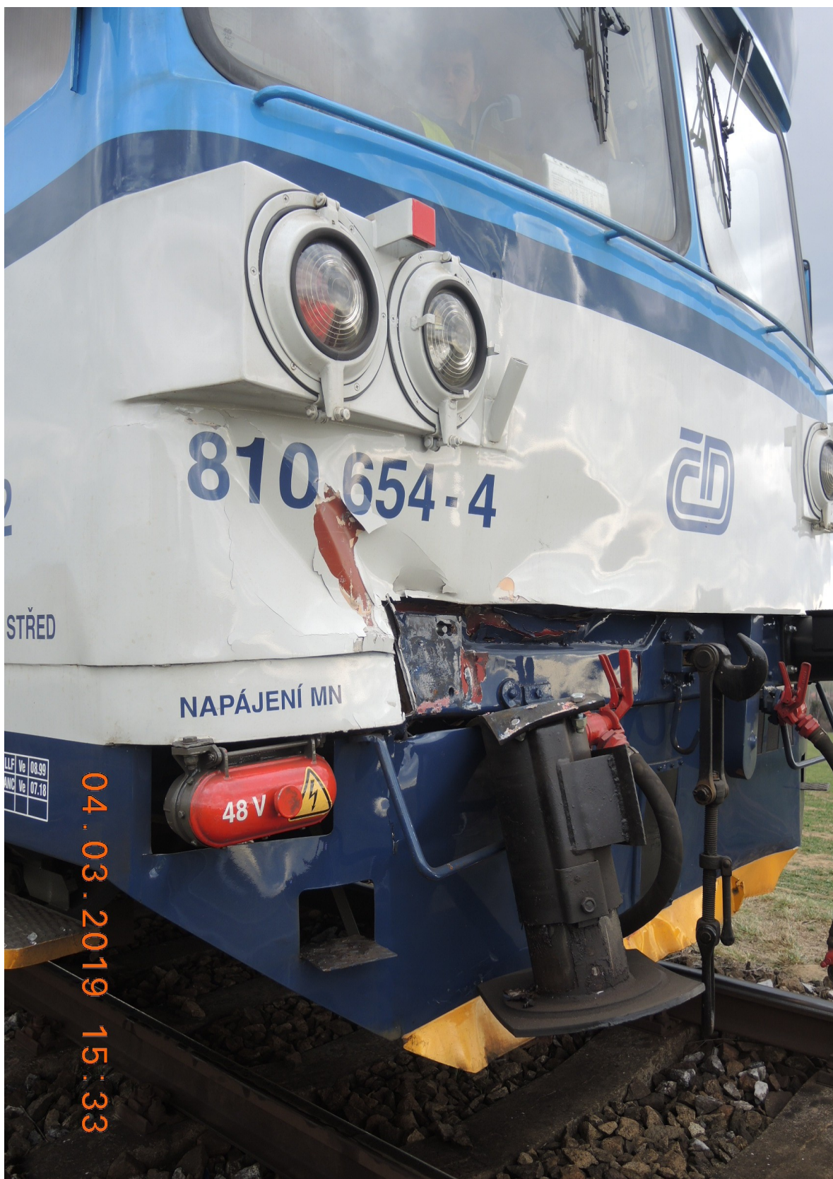
Obr. č. 4: Vlivem srážky byl utržen pravý nárazník HDV vlaku Os 15912. V místě nálezu ustřižených šroubů v koleji byl určen km srážky 11,118