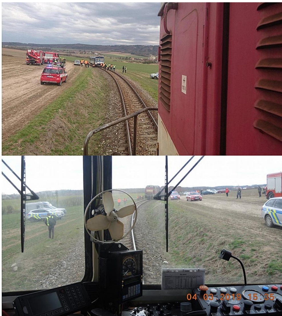
Obr. č. 2. Výhled strojvedoucího, poloha DV po zastavení

pravého nárazníku HDV vlaku Os 15912. K vykolejení DV nedošlo, byla poškozena obě HDV, škoda na infrastruktuře nevznikla. Ve vlaku Os 15912 cestovalo celkem asi 15 osob včetně strojvedoucího a vlakvedoucího. Strojvedoucí a 5 cestujících bylo zraněno, z toho jedna cestující utrpěla vážné zranění. Všechny zraněné transportovala ZZS k lékařskému ošetření.