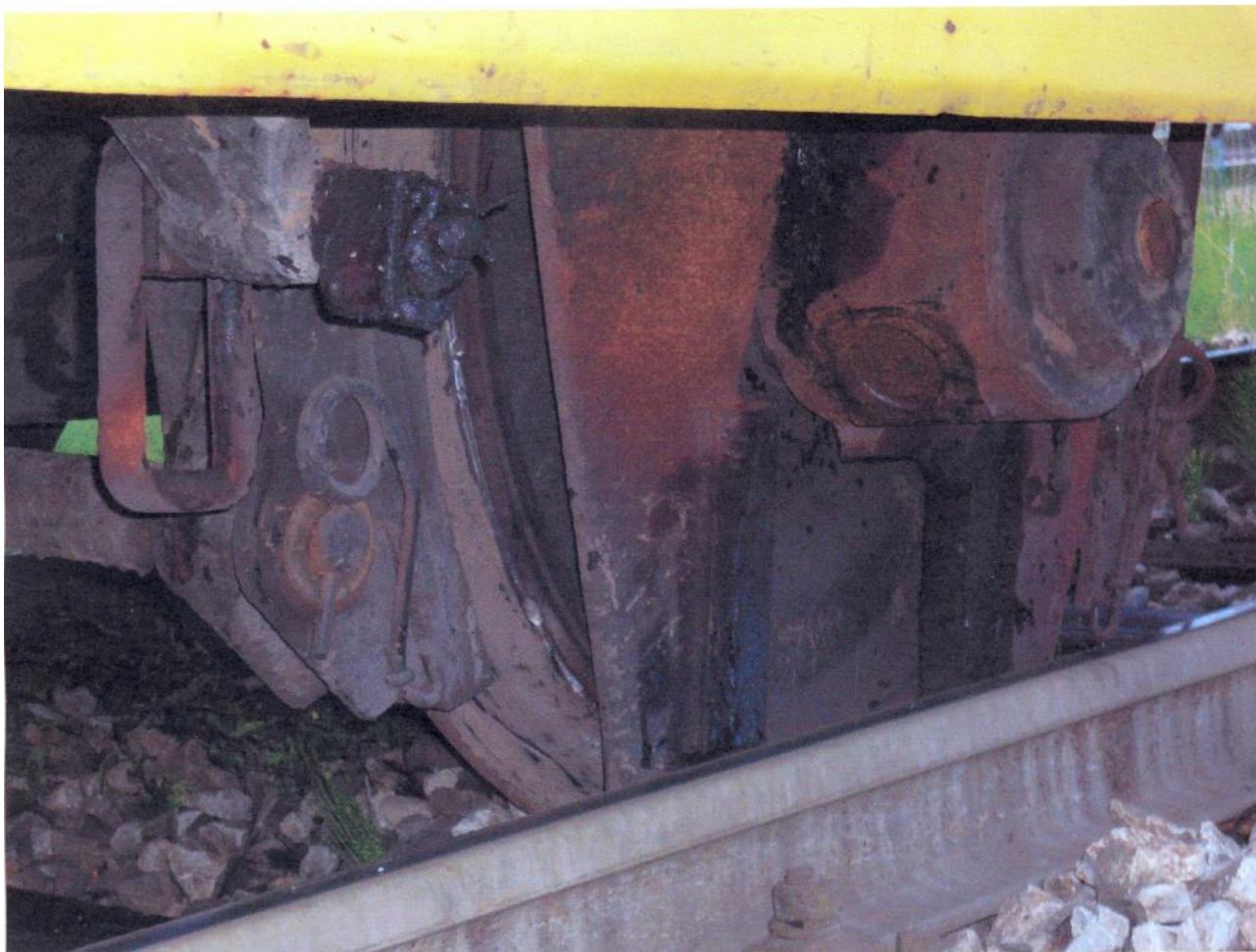
Slika 3 – Mjesto oštećenja na vagonu