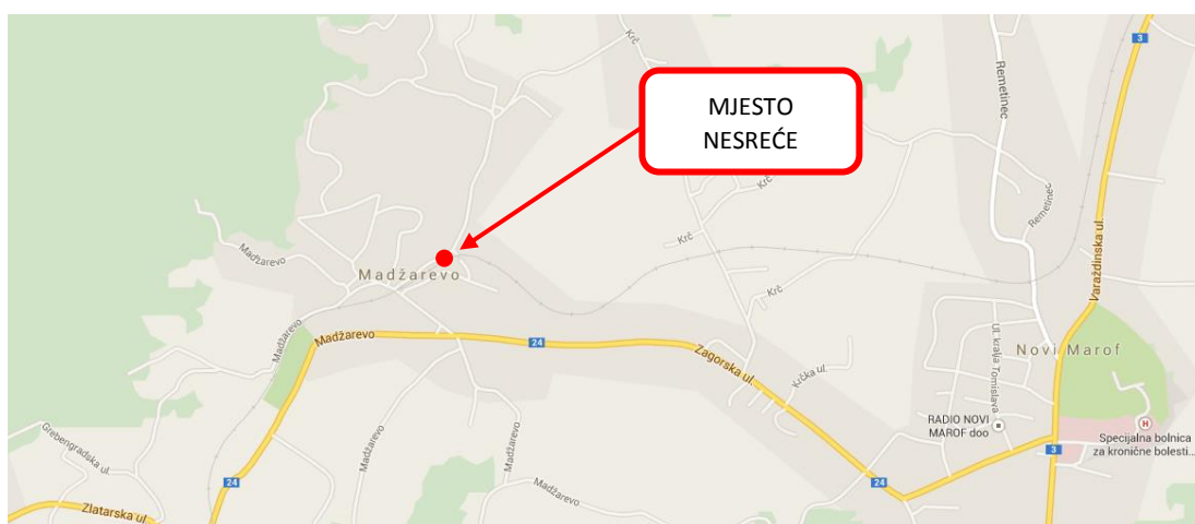
Slika 1 – karta područja mjesta nesreće

Iskliznuće se je dogodilo na km 068+270 na pruzi R201 Zaprešić-Čakovec, neposredno kod stajališta Mađarevo.