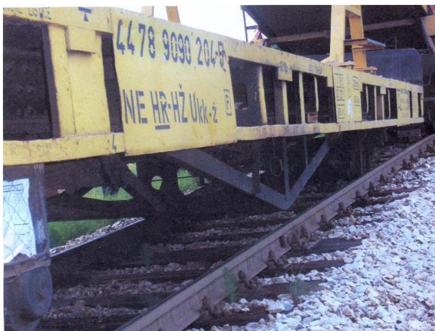
Slika 2 – Mjesto nesreće sa iskliznulim vagonom