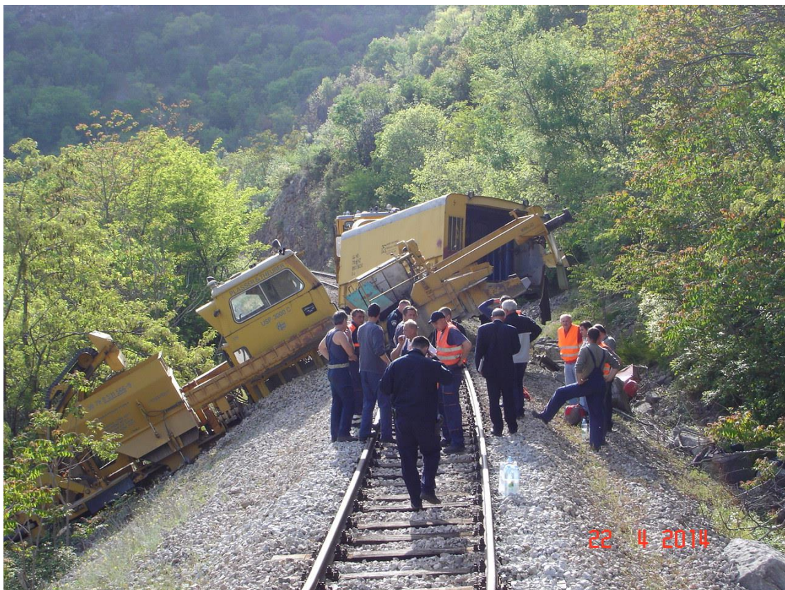
Slika 2 – Mjesto nesreće sa iskliznulim vozilima