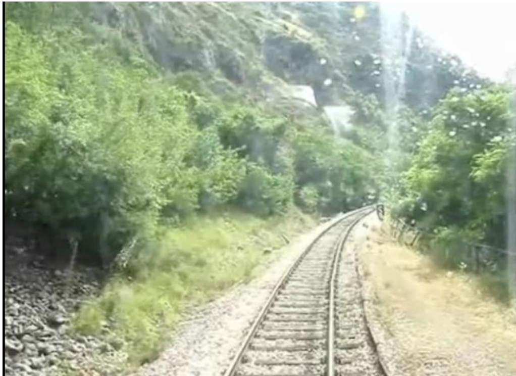
Slika 5 – Stajalište Očestovo