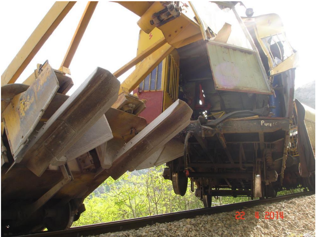
Slika 3 – Pozicija iskliznutih vozila nakon zaustavljanja

Predmetni vlak je dana 22. travnja 2014. (utorak) istoga dana u jutarnjim satima prošao dionicu pruge Knin-Zadar u suprotnom smjeru kada na istoj nije bilo odrona.