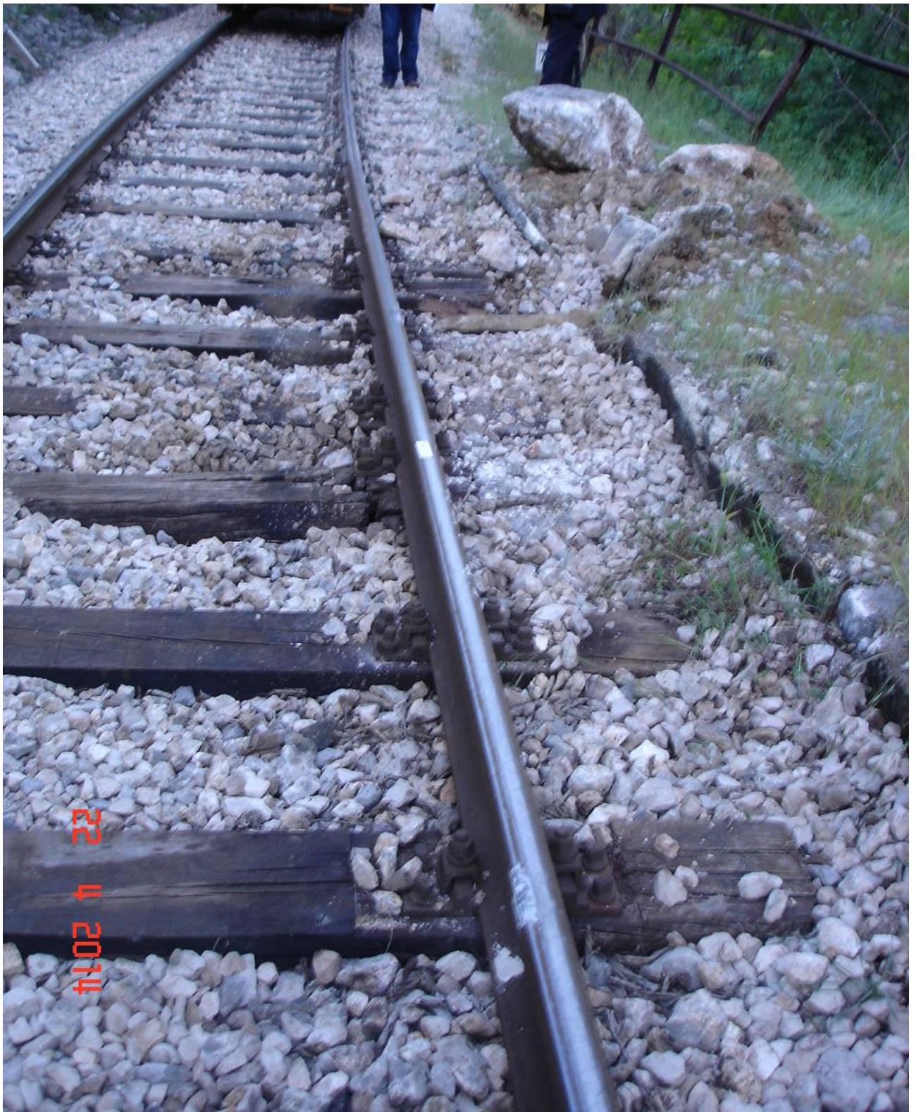
Slika 4 – Oštećenja pruge na mjestu odrona