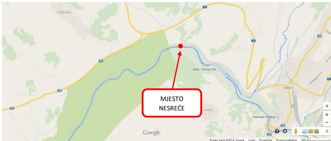
Slika 1 – karta mjesta nesreće

Nesreća se je dogodila oko 100 metara iza stajališta Očestovo na pruzi M606, na km 5+700, u smjeru Knina.