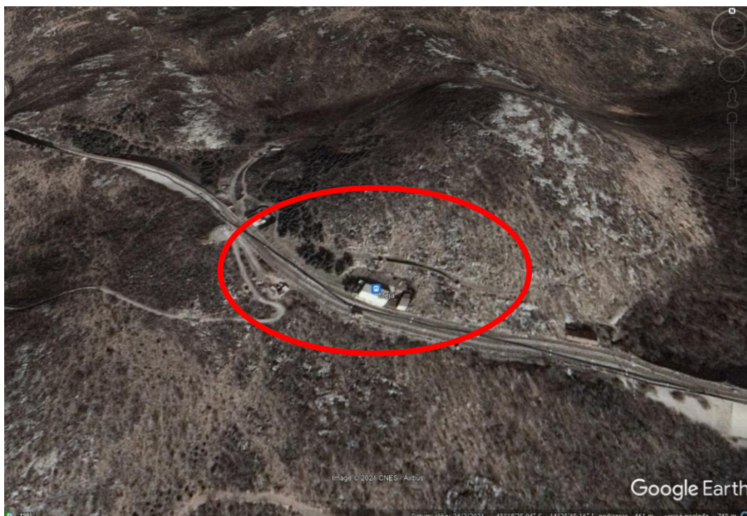
Slika 2. – Lokacija zaustavljanja iskliznulog vagona