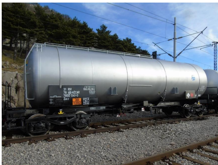
Slika 1. Iskliznuli vagon

U navedenoj nesreći nije bilo usmrćenih i ozlijeđenih osoba, dok je nastala značajna materijalna šteta na željezničkoj infrastrukturi i teretnim vagonima.