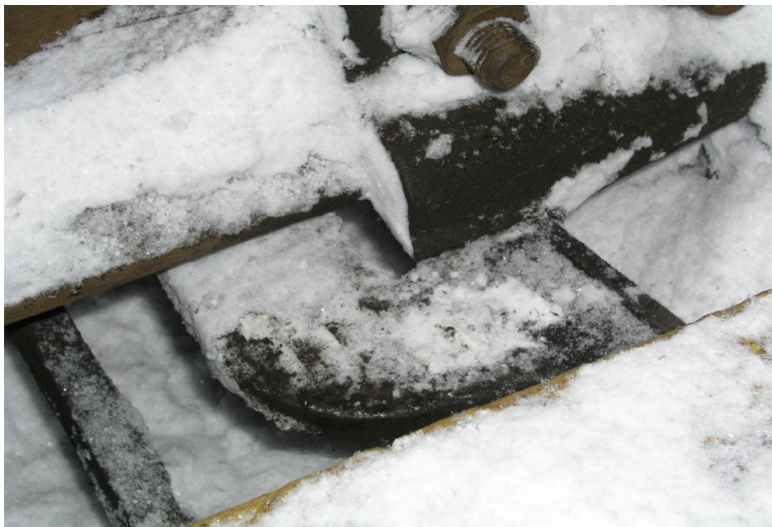
4. pohled na poškozený hákový závěr výhybky č. 15 žst Bystřice nad Olší, svěrací čelist bez dolní pracovní části (stav po vykolejení)