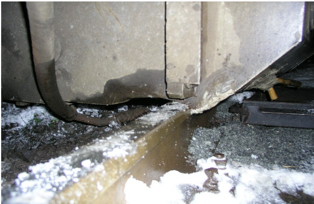
2. Pohled na poškozenou nádrž pohonných hmot HDV řady 742.126-6