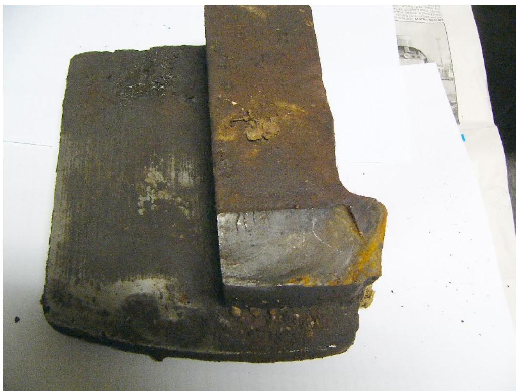
5. Svěrací čelist - odlomená dolní pracovní část