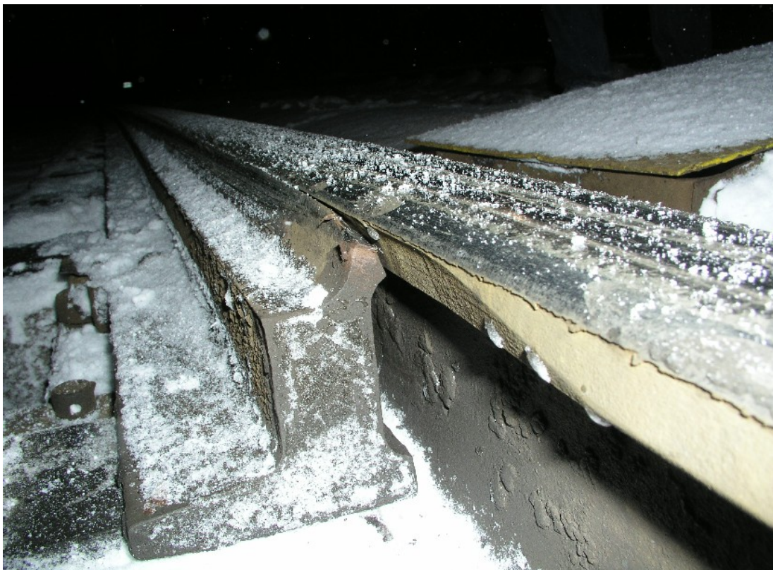
3. Pohled na komisionálně stanovený bod "0" - první stopa po vykolejení HDV řady 742.126-6 na výhybce č 15 žst. Bystřice nad Olší v km 305,520 trati Mosty u Jablunkova st. hr - Bohumín. Naražený hrot pravého ohnutého jazyka po odtažení nevykolejených TDV