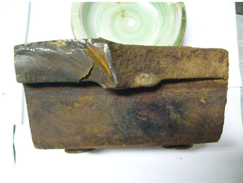
6. Svěrací čelist - horní část upevněná k opornici, pohled na lomovou plochu