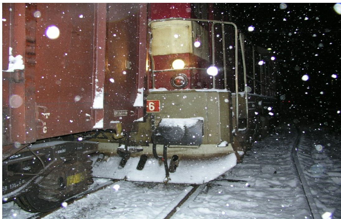
1. Pohled na hnací drážní vozidlo řady 742.126-6 jedoucí v čele vlaku Mn 80203 ve vykolejeném stavu za výhybkou č. 15 žst. Bystřice nad Olší

Fotodokumentace z místa vzniku mimořádné události - nehody ze dne 27. 11. 2007, vykolejení HDV řady 743.126-6 za jízdy vlaku Mn 80203 na dráze železniční celostátní Mosty u Jablunkova st. hr. - Bohumín v km 305,520 na výhybce č. 15 žst. Bystřice nad Olší.