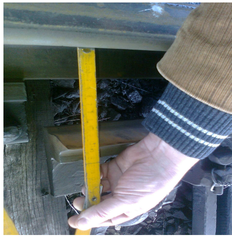
Figura nr.2 (macaz neînzăvorât - cursă de înzăvorâre incompletă)