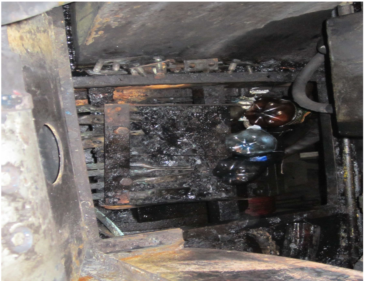
Fig.2. Cablurile de forță MT 4