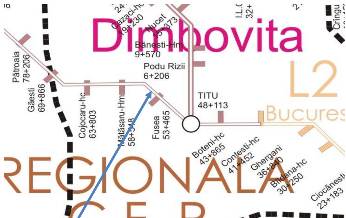
Fig.1. Locul producerii accidentului

În data de 03.05.2013, trenul de marfă nr.71734 a fost expedit la ora 17.05 din stația Călinești în direcția Galați Brateș pe relația Călinești – Chitila – Brazi – Galați Brateș având în componere 37 de vagoane goale, 148 osii, tonaj brut 1108 tone, frânat automat 554/1054 tone, frânat de mână 111/651tone, lungime 543m, fiind remorcat cu locomotiva diesel-electrică DA 60-1362-7. Locomotiva și personalul care o conducea respectiv deservea aparțin operatorului de transport feroviar de marfă SNTFM "CFR Marfă" SA.