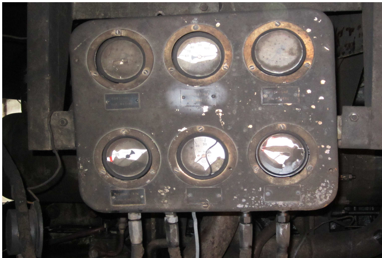
Fig.4. Panoul de supraveghere al motorului diesel afectat termic