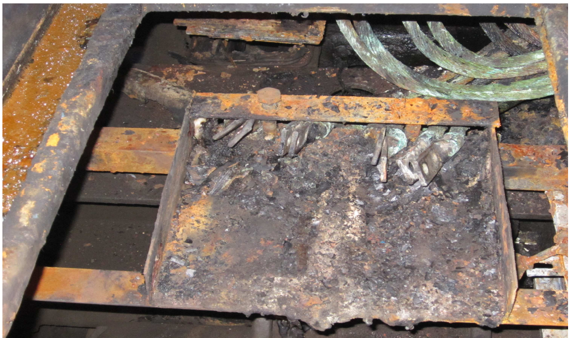
Fig.3. Cablurile de forță de la EMT 5