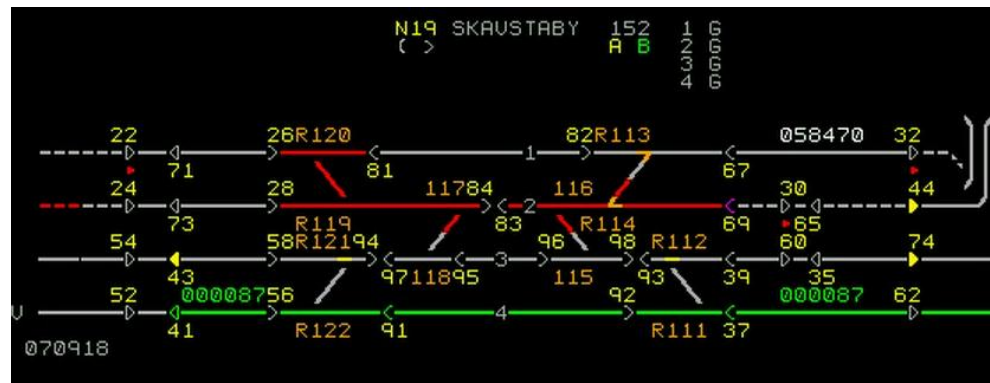
Figur 1. Översikt för växel 111 (R framför växelnumret innebär att växeln har rörlig korsningspets).