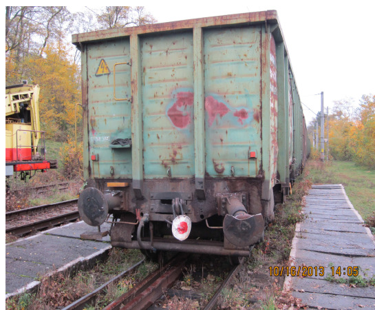
Fig. nr.2: Urmările coliziunii dintre DP58 și vagonul de marfă

În urma avizării producerii acestui accident feroviar, efectuată conform prevederilor reglementărilor specifice, la fața locului s-au deplasat specialiștii ai OIFR, Autorității de Siguranță Feroviară Română, administratorului de infrastructură feroviară publică CNCF, „CFR” SA și operatorului de transport feroviar SC UNICOM TRANZIT SA”.