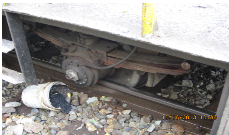
Fig. nr.2: Drezina pantograf DP 58 deraiată