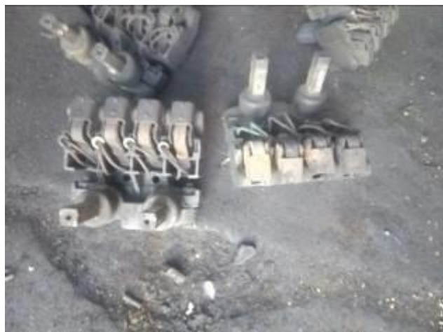
Foto nr.6 suportți portperii supraîncălziți