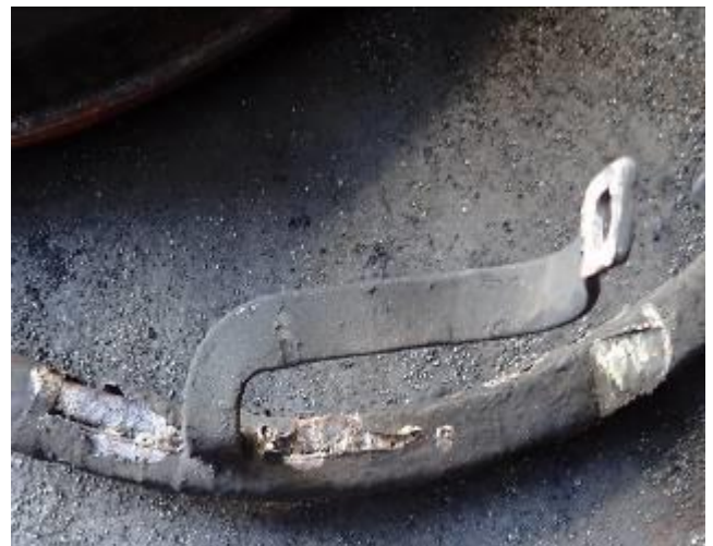
Foto nr.4 izolația carbonizată pe bara de înseriere