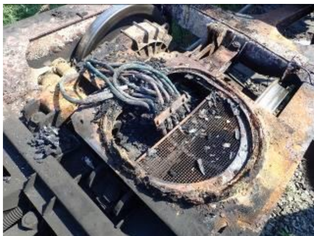
Foto nr.7 cablurile de alimentare cu izolația arsă