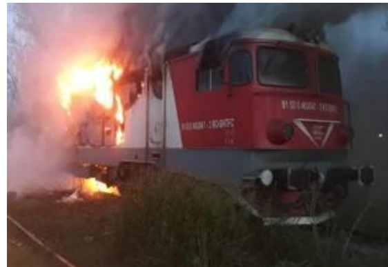
Foto nr.11 – Evoluția în timp a modului de propagare a incendiului