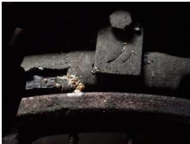
Foto nr.3 punct de arc electric pe bara de înseriere