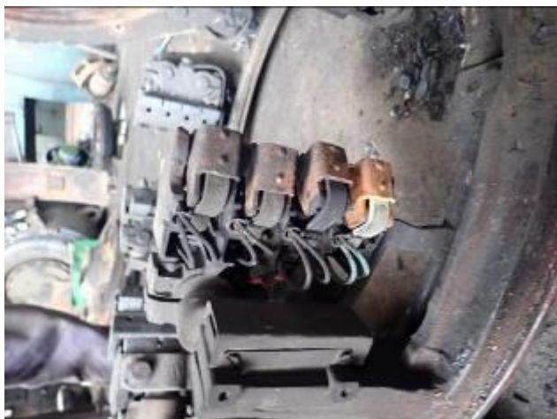
Foto nr.5 suportți portperii supraîncălziți