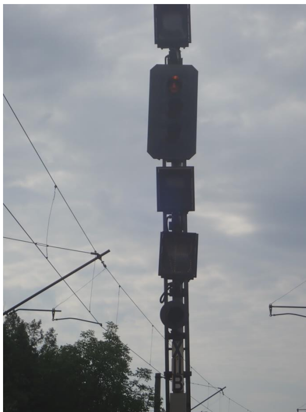
Semnalul de ieșire XIIB al stației Constanța Oraș cu indicator de direcție A și B.