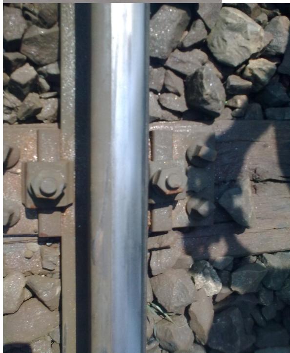
Fig.nr.2-urmă cădere roata 6