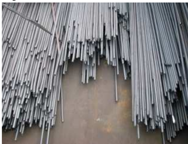
Fig. nr.3: Marfa încărcată în mod necorespunzător în vagoane