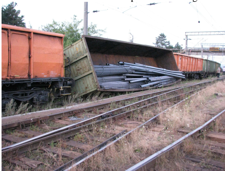
Fig. nr.2: Vagonul seria Eaos nr. 33535304702-0 deraiat

Vagonul deraiat seria Eaos nr. 33535304702-0 se prezintă ca în figura nr.2