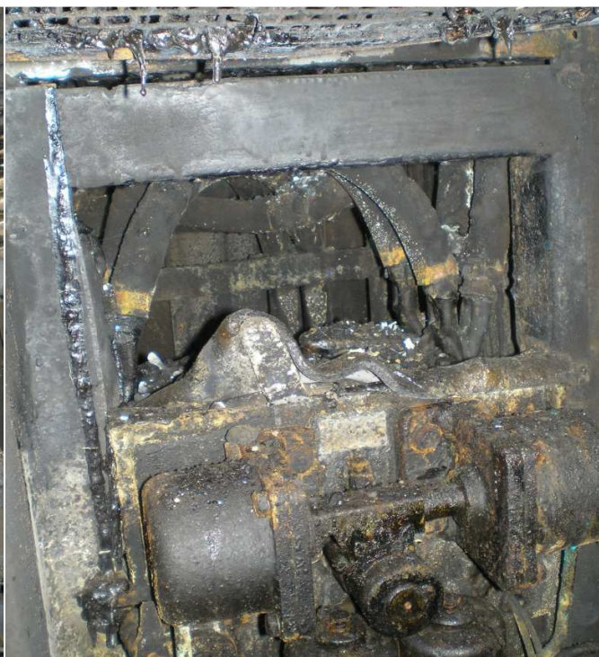
Fig.6. Inversor MT3