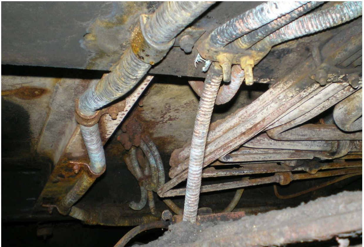
Fig.2. Cabluri BAC - S7