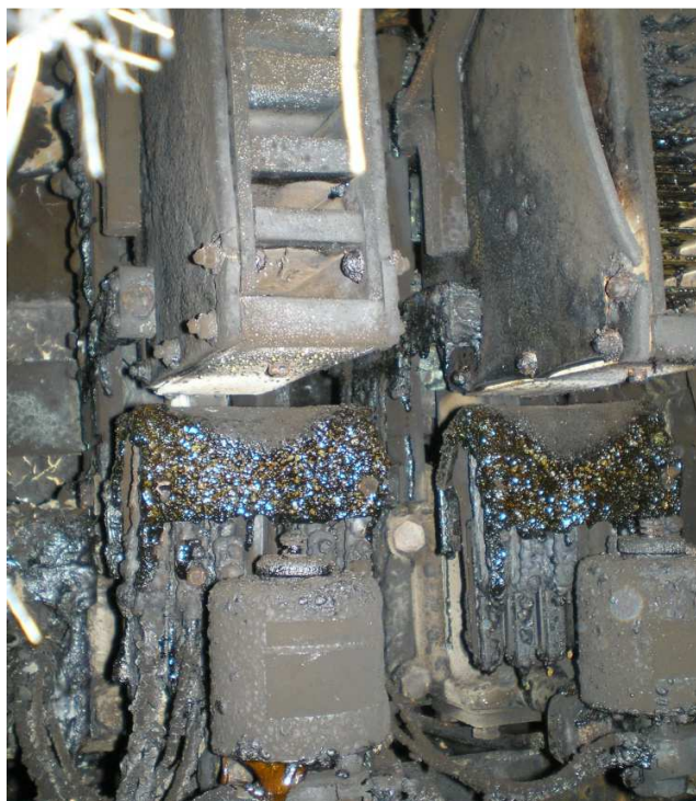
Fig.5. Contactori de linie MT3