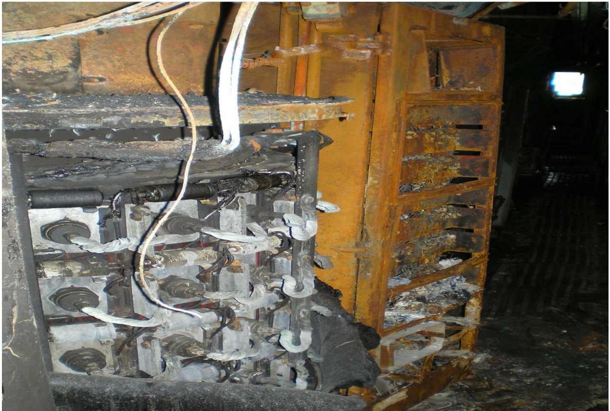
Fig.3. Redresor blocul S3