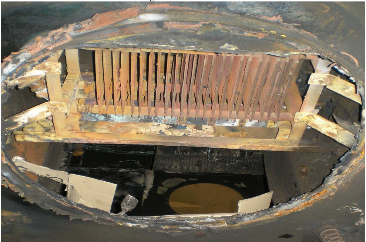
Fig.4. Blocul S3 vedere de sub locomotivă