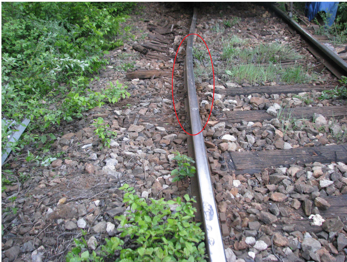
Figura 7 - cele 4 urme de deraiere pe partea stângă

S-au identificat totodată în zona punctului “0” un număr de 4 urme de deraiere pe partea stângă în sensul de mers (căderea roții de pe ciuperca șinei) Figura 7