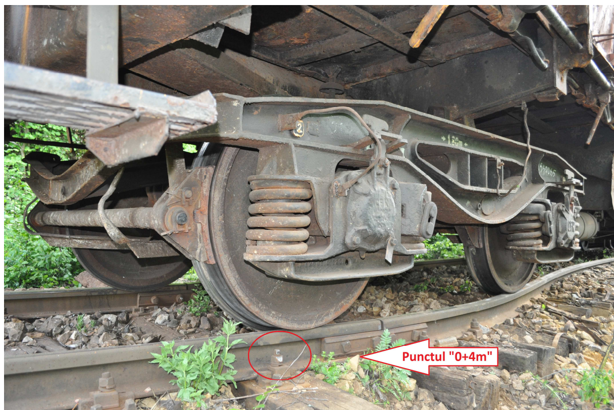
Figura 4 - Urma de deraiere denumită Punctul “0+4m”

Urma de deraiere menționată a fost denumită Punctul “0+4m” și este prezentată în Figura 4