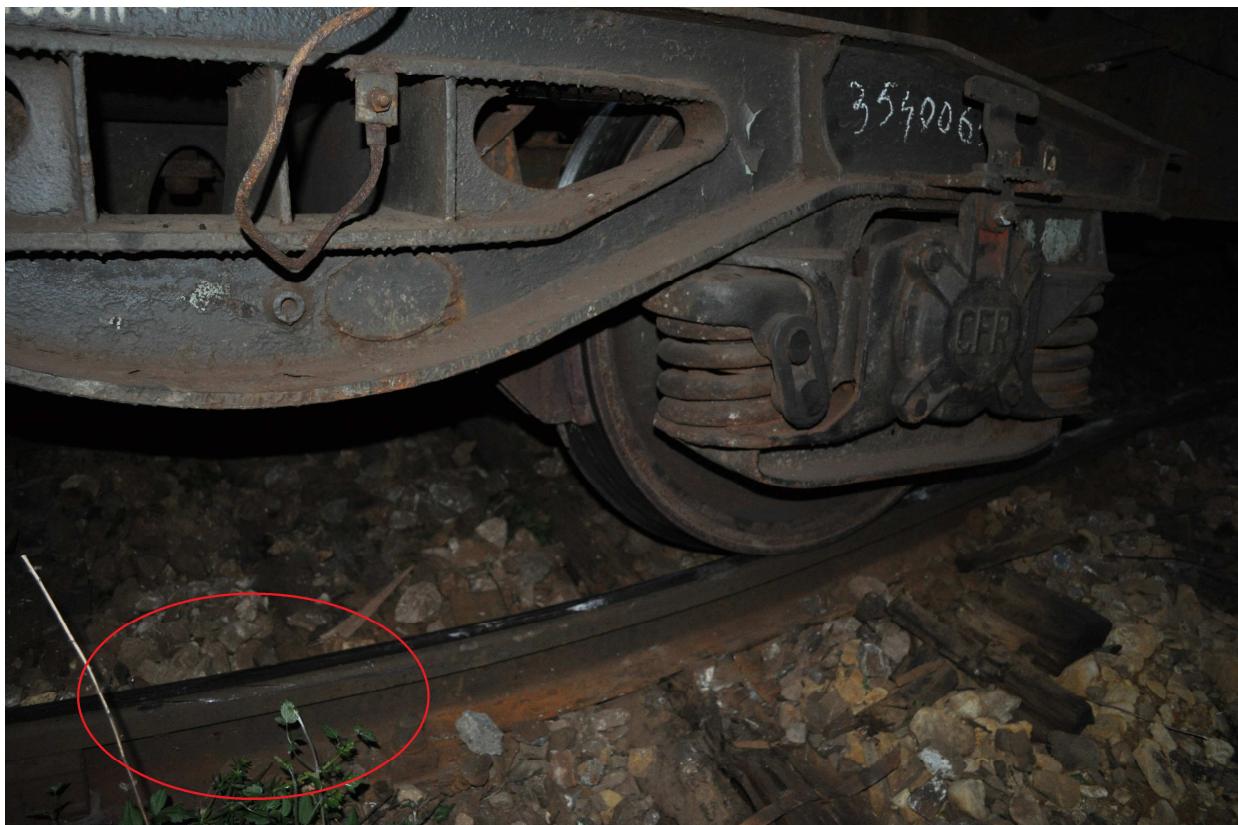
Figura 6 - 2 urme de deraiere pe partea dreaptă