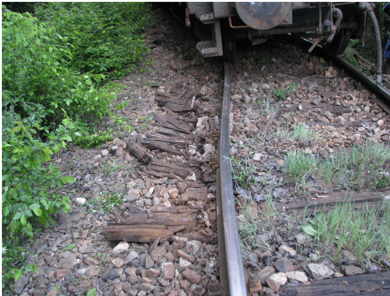
Figura 3 - deformațiile provocate la linie de către vagoane în timpul deraierei

S-au efectuat verificări asupra stării căii în sens invers sensului de mers al trenului începând din punctul "0" pe o distanță de 30 m.