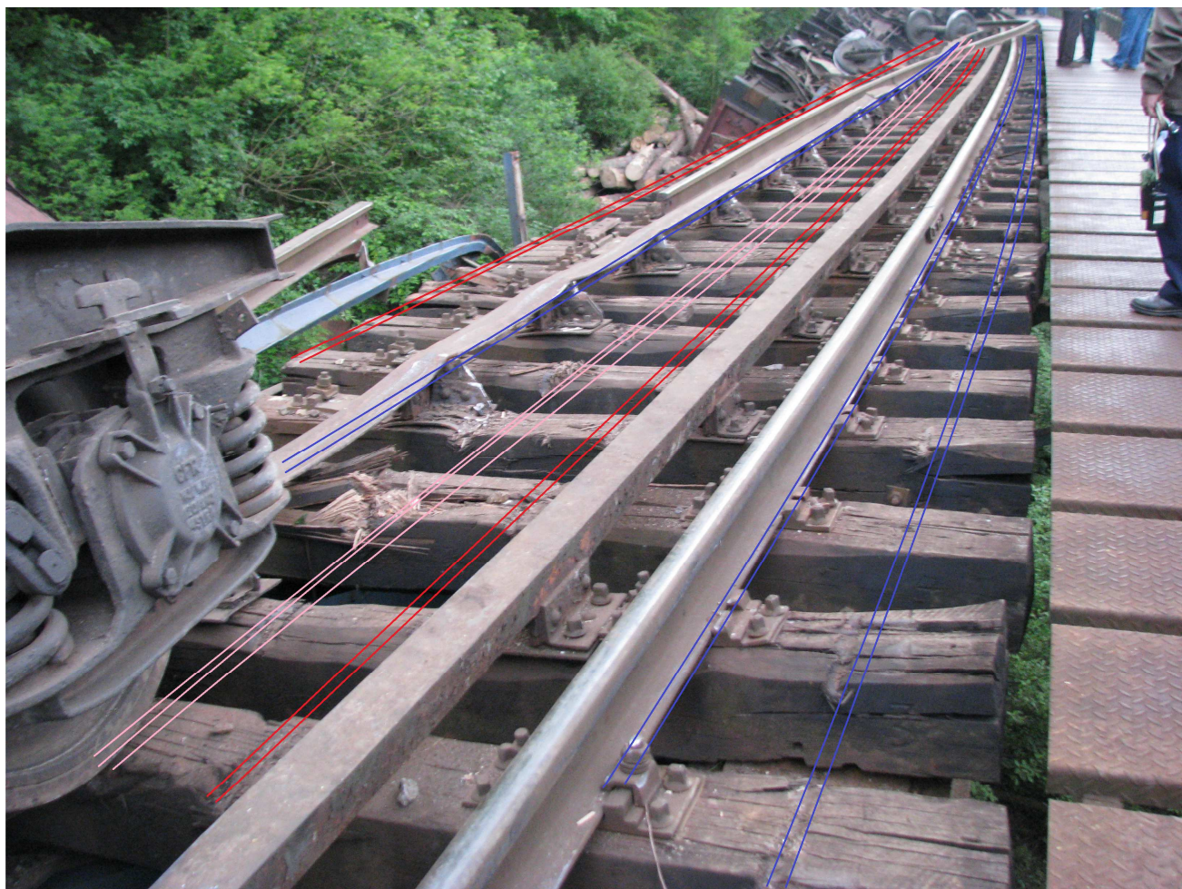
Figura 9 Urmele lăstate pe pod de vagoanele deraiate

După identificarea urmelor, estimarea distanțelor dintre seturile de urme și în corelare cu alte elemente tehnice, s-au concluzionat următoarele: