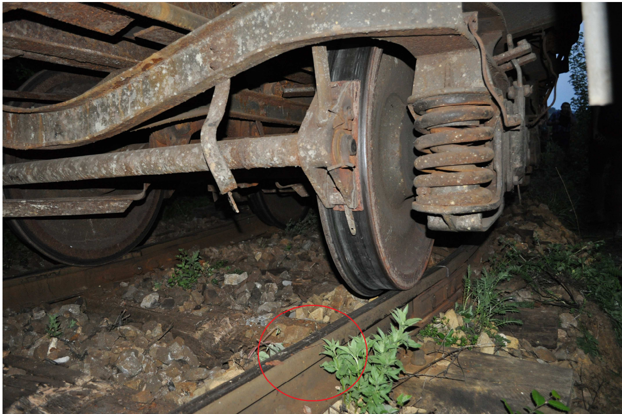
Figura 5 - O urmă de deraiere pe partea dreaptă