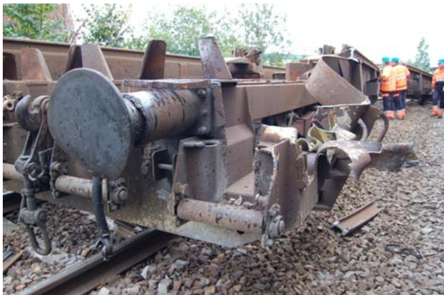
Figur 1: Skader i front venstre side på vogn 4076 943 1033-2

Det ble registrert til dels betydelige skader på de to avsporede vognene fra tog 66024. Vogn nr.4076 943 1033-2, den første av de avsporede vognene, hadde skader som klart kunne henføres til sammenstøtet med tog 5722 (jf fig.1). Vognen hadde imidlertid også en annen skade på bakre del av sidebjelken (jf fig. 2). Vogn nr. 4076 943 1034-0, den bakerste av de avsporede vognene, hadde moderate skader på hjul og akselkasseføringer.