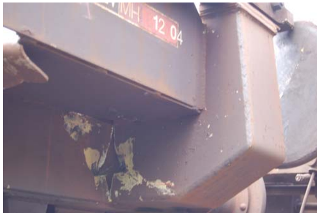
Figur 2: Skader på bakre del venstre side av sidebjelke på vogn 4076 943 1033-1

Lokomotivet i tog 5722, El 14 2186, hadde skader på venstre buffer, plog, fremste boggi inkludert fjæroppheng, jf fig. 3 og 4. Det ble ikke registrert skader på dette togets vogner eller last.