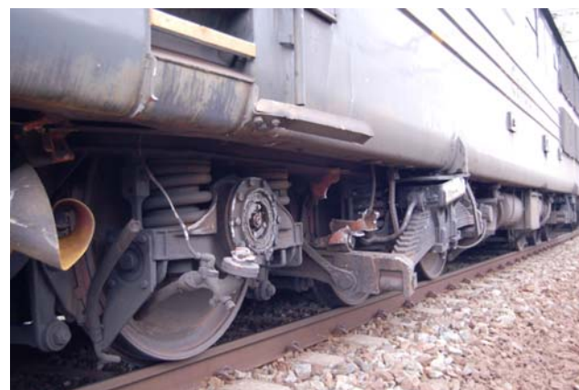
Figur 4: Skader på boggi og fjæroppheng på lokomotivet i tog 5722

I sporet hvor tog 66024 kjørte ble det registrert en del sviller med skader etter avsporede hjul. I sporet hvor tog 5722 stod ble det funnet merker etter en ytre påvirkning som hadde flyttet skinnegangen ca. 30 cm sideveis over en kort lengde og gitt brudd i skinnestrengen nærmest nabosporet, jf fig. 5 og 6.