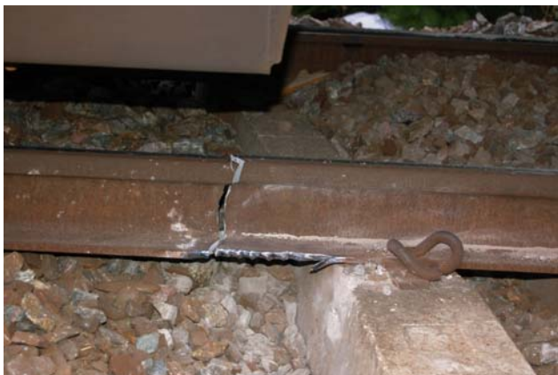
Figur 5: Merker etter en kraft mot venstre skinne i hovedspor Lillestrøm - Oslo S