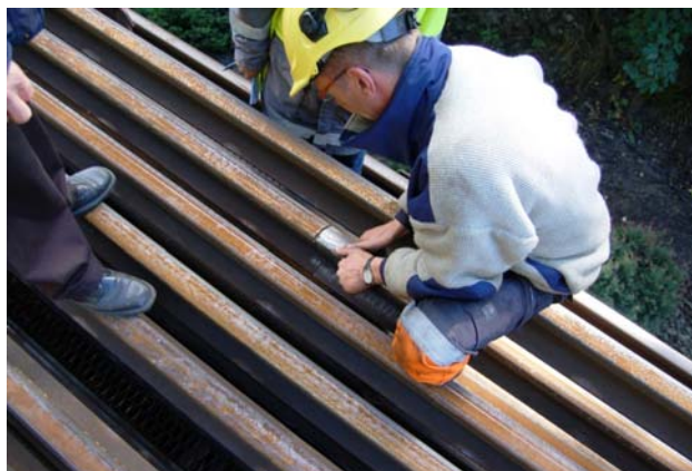
Figur 8: Verifikasjon av at skinnestubben var en del av lasten i tog 66024

Bruddflaten på skinnestubben viste at det på bruddstedet hadde vært en sprekk i skinna som omfattet det meste av skinnhodet.