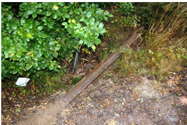
Figur 7: Skinnestubb funnet på høyre side av hovedspor Lillestrøm - Oslo

På høyre side av hovedspor Lillestrøm - Oslo ble det funnet en ca 3,5 m lang skinnestubb som bar preg av nylig å ha havnet der. Det ble senere verifisert at denne skinnestubben var en del av lasten til tog 66024 jf. figur 7 og 8.