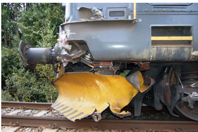
Figur 3: Skader på front av lokomotiv i tog 5722

Lokomotivet i tog 5722, El 14 2186, hadde skader på venstre buffer, plog, fremste boggi inkludert fjæroppheng, jf fig. 3 og 4. Det ble ikke registrert skader på dette togets vogner eller last.